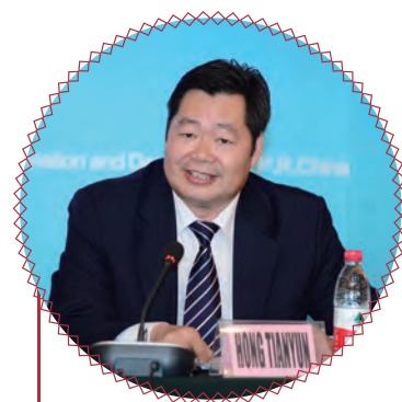
国务院扶贫办副主任 洪天云开幕式致辞