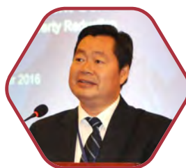
国务院扶贫办 副主任 洪天云