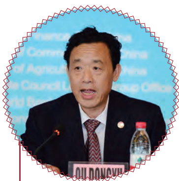
农业部副部长 屈冬玉开幕式致辞