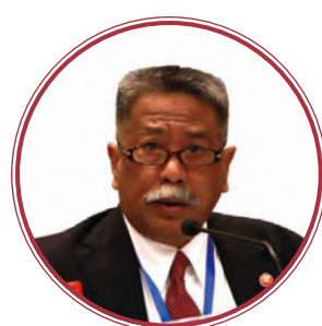
东盟秘书处 副秘书长 穆赫坦 (AKP Mochtan)

时任国务院扶贫办副主任郑文凯，广西壮族自治区人民政府副主席黄世勇，老挝国家农村发展与减贫委员会副主席苏万那拉 (Somsanith Souvannalath)，柬埔寨农村发展部副国务秘书哈普 (Hap Omaly)，东盟秘书处副秘书长穆赫坦 (AKP Mochtan)，桂林市市长周家斌等出席开幕式并致辞。时任国务院扶贫办国际合作和社会扶贫司司长李春光主持开幕式。