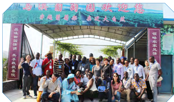
非洲法语国家开发式扶贫政策与实践官员研修班学员到江苏省镇江市恒顺集团参观。