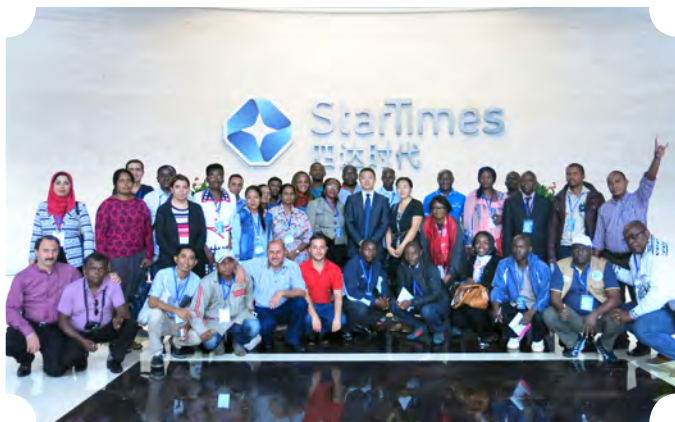
亚洲国家城乡协调发展与减贫官员研修班学员到北京四达时代公司考察。