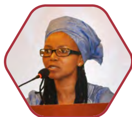
非盟贸易工业 委员特别代表 特蕾耶·玛方嘉 (Treasure Maphanga)