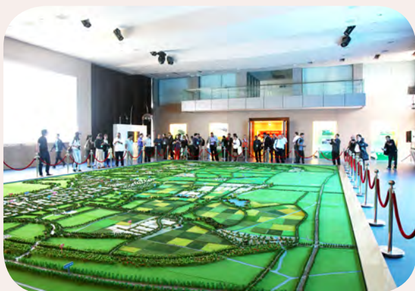
代表赴上海市现代农业园区项目点考察

活动期间，全体代表赴上海市金山区实地考察了爱索特植物园艺（上海）有限公司、智能化农业基地（金山区蔬菜研发中心）、施泉葡萄专业合作社等项目点。此外，全体代表还与村民和村干部进行了座谈。