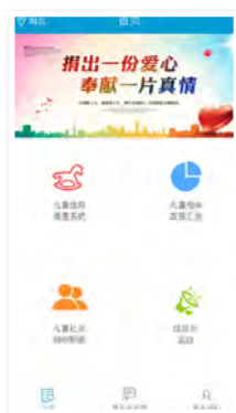
儿童贫困数据收集app首页