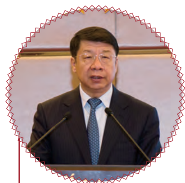
财政部副部长 史耀斌开幕式致辞

2016年9月2-8日，由财政部、商务部、农业部、国务院扶贫办、世界银行和国际农发基金共同主办，中国国际扶贫中心承办的“第八届中国非共享发展经验高级研讨班”在京召开。国务院扶贫办副主任洪天云出席开班仪式并致辞，财政部副部长史耀斌、农业部副部长屈冬玉、世界银行中国局局长郝福满、国际农发基金总裁特别顾问吴晋康、商务部国际商务官员研修学院院长李小兵，苏丹农业部副次长纳比尔·艾哈迈德·穆罕默德·萨德等出席开班仪式并致辞。