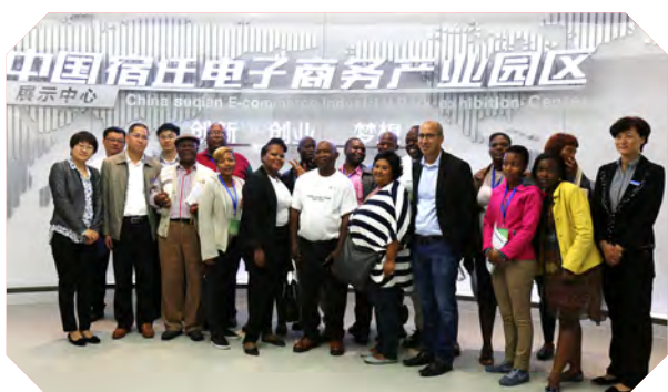
南非农村发展政策与实践研修班学员到江苏宿迁电子商务产业园区考察。