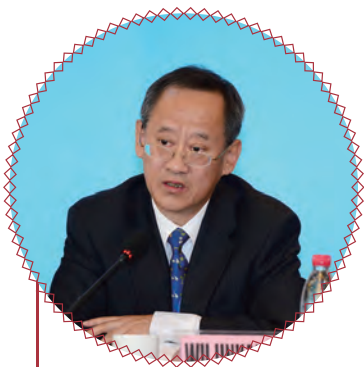
国际农发基金总裁特别 顾问吴晋康开幕式致辞