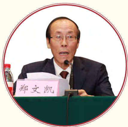
时任国务院扶贫办 副主任 郑文凯

郑文凯副主任在致辞中指出，在保证国内完成脱贫攻坚目标推进的同时，中国政府积极开展国际减贫合作，特别是与东盟国家的减贫交流与合作。2014年11月，李克强总理提出“东亚减贫合作倡议”；2015年10月，习近平主席在出席2015减贫与发展高层论坛时指出，将加强南南合作，为全球减贫事业提供充足资源和强劲动力，落实好“东亚减贫合作倡议”，更加注重让发展成果惠及当地民众。