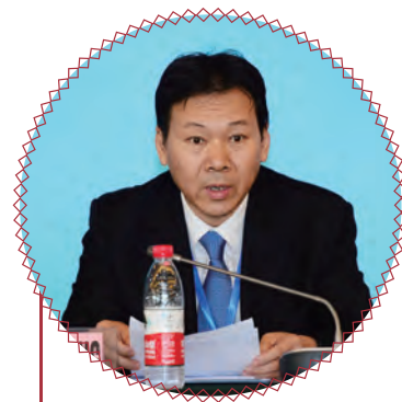
商务部国际商务官员研修学院 院长李小兵开幕式致辞