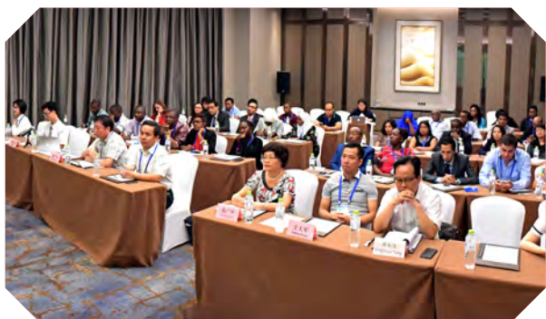
发展中国家农村发展与减贫官员研修班学员上课。