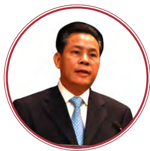
广西壮族自治区人民政府 副主席 黄世勇

来自中国和东盟十国的政府官员、专家学者、媒体、中资企业代表、非政府组织代表及国际组织代表150余人与会。本届论坛主题为“一带一路与中国东盟减贫合作”。