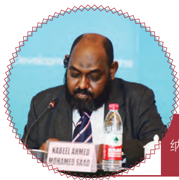
苏丹农业部副次长 纳比尔·艾哈迈德·穆罕默德·萨德开幕式致辞