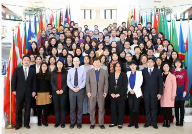
2016年2月派出3名员工参加商务部培训中心与世界银行学院联合组织的“知识交流技巧”专题培训班。