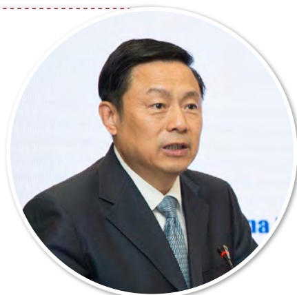
国务院新闻办公室 副主任 郭卫民

国务院新闻办公室副主任郭卫民在论坛上做主旨发言，他表示将中国的扶贫经验分享给全世界，为发展中国家提供借鉴，是中国义不容辞的责任；将国际上的有益经验引入中国，推动中国扶贫工作的发展，也是中国的希望。交流与沟通，合作与共享，是中国与世界在攻克贫困问题过程中的必然选择。他指出，减贫是人类社会的共同事业。中国国务院新闻办将致力于为中国与世界在这一领域间的沟通架构桥梁，推动交流与合作。