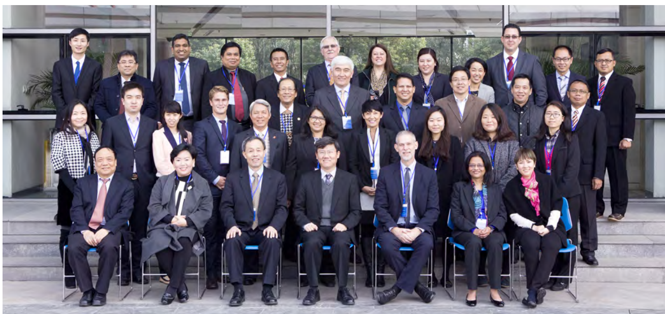
2016年3月，派出3名员工赴上海参加亚太财经与发展学院组织的“GDLN（全球发展学习网络）亚太地区业务交流会”。