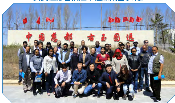
发展中国家包容性增长与持续减贫官员研修班学员到中国葱都山西省右玉县考察。