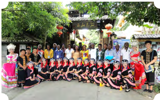
喀麦隆减贫致富经验交流研修班学员到广西河池巴马县仁寿山庄考察旅游扶贫项目。