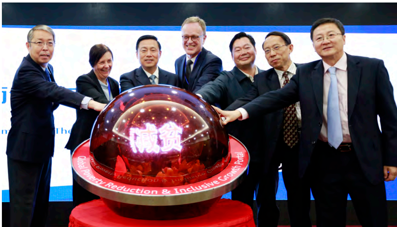
“2016中国扶贫国际论坛暨南南合作减贫知识分享网站开网仪式”在京举行。