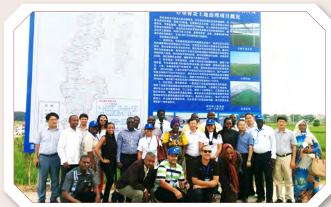
学员参观考察南京市溧水区和凤镇高标准农田建设项目

自2008年以来，中非共享发展经验高级研讨班连续成功举办八届 ，研讨班已成为中非共同交流和探讨发展问题、促进南南合作的重要平台。