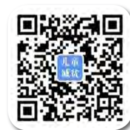
儿童减贫与发展微信公众号