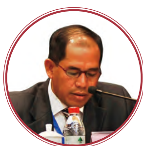
柬埔寨农村发展部 副国务秘书 哈普 (Hap Omaly)