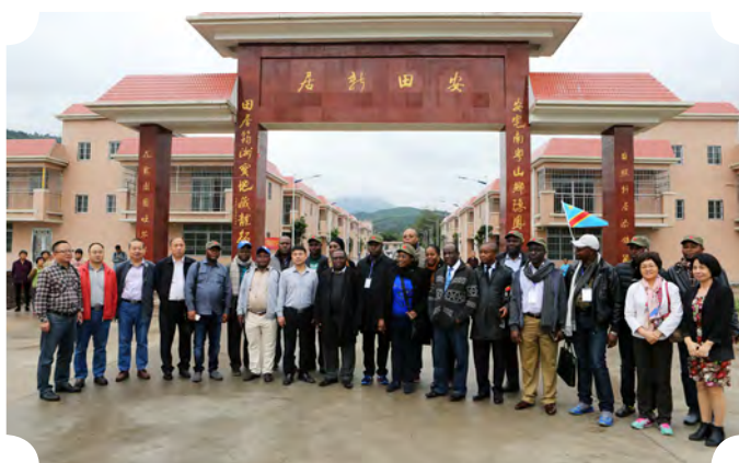
刚果（金）高层交流与合作部长研讨班学员到广东省清远市连南县安田村考察移民搬迁项目。