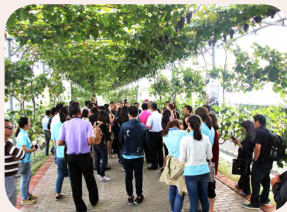
代表赴上海市施泉葡萄专业合作社项目点考察