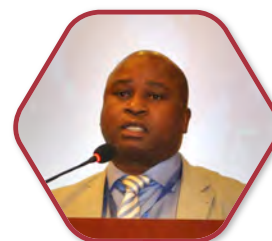
南非农村发展与 土地改革部 副部长 穆塞比斯·斯科瓦特沙 (Mcebisi Skwatsha)