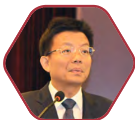
上海市 副市长 时光辉