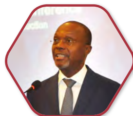
联合国开发计划署 非洲局代表 巴巴卡·西塞 (Babacar Cisse)

中非合作论坛-减贫与发展会议的前身是中非减贫与发展会议。该会议自2010年开始，已成功举办了七届，议题涉及中非减贫经验、农业发展与减贫、基础设施建设与减贫、经济特区与减贫等。六年来，在各方共同努力下，该会议已成为中国对非减贫交流的核心平台之一。随着会议影响力的提高，中非减贫与发展会议被纳入中非合作论坛总体框架成为分论坛之一，从而为中非国家间开展广泛、务实的减贫合作提供了更大支持和有力保障，进一步体现了中非双方对减贫合作的重视。中非合