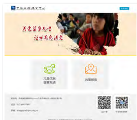
研发儿童信息采集与分析系统PC端页面