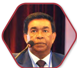
毛里求斯社会融合 和经济增长部 部长 普里特维拉杰辛格·鲁蓬 (Prithvirajsing Roopun)