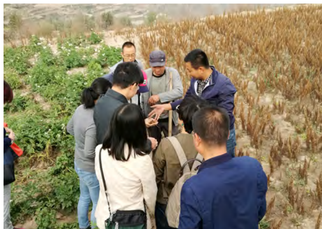
2016年9月派出2名员工参加世行“现代农业项目三省督导团”实地考察。