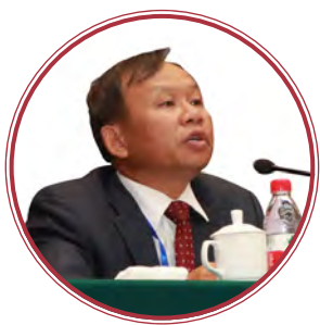
老挝国家农村发展与减贫委员会 副主席 苏万那拉 (Somsanith Souvannalath)